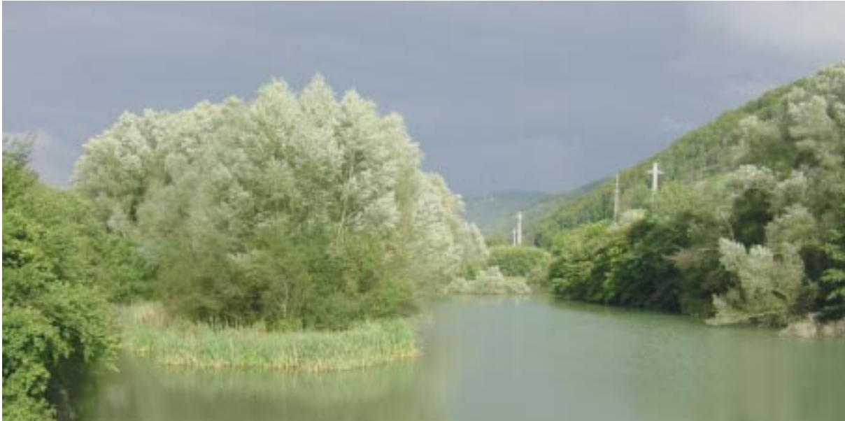
Paisaje de la zona